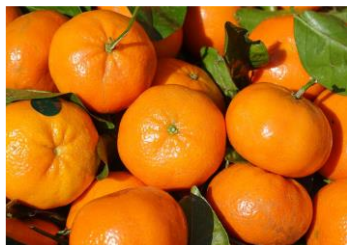
曼达林和橘子提取物

济州曼达琳和橘子提取物富含 维生素C ，令肌肤清爽洁净。它还可以使皮肤恢复活力，使其保持活力和健康。