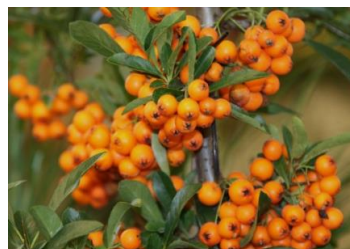
维他命树果提取物

它具有牵引废物的特性，因此有助于清除皮肤上的废物，其中所含的 维生素 可保持皮肤清洁。