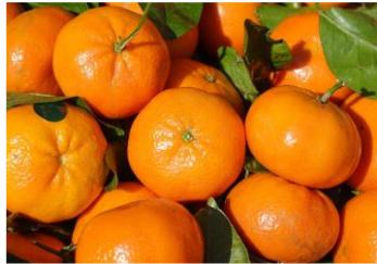
만다린 & 감귤 추출물

제주산 만다린&감귤추출물의 풍부한 비타민 C가 피부를 맑고 깨끗하게 케어 해 줌 또한 피부에 활력을 부여하고 생기 있고 건강하게 유지해 줌